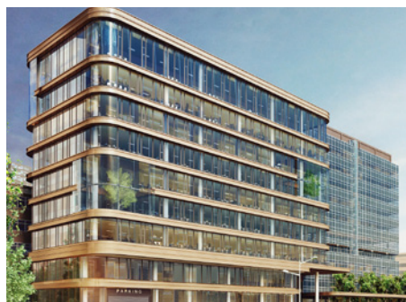
Atrium - Strawinskylaan 3001-4111 - Amsterdam - Pays Bas