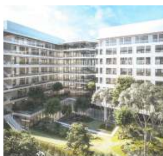
Evidence - Zac des Docks 93400 Saint-Ouen - VEFA