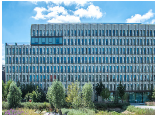
Coruscant - 17 rue Jean-Philippe Rameau - 93200 Saint-Denis