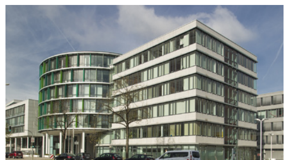
Loopsite - Werinherstrasse 78,81,91 D 81541 - Munich - Allemagne