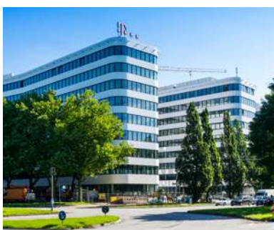
Telekom Campus - Überseering 2 22297 Hamburg - Allemagne