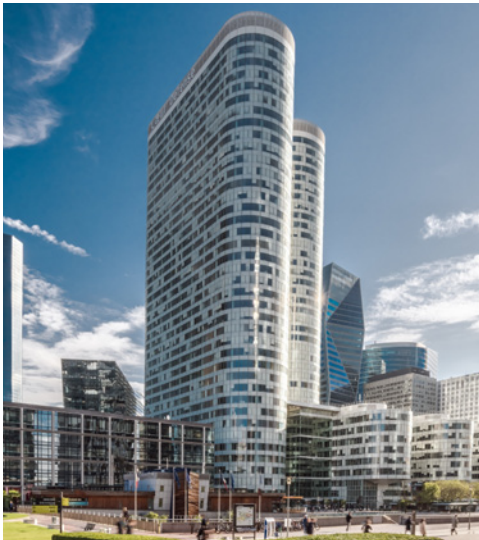
Cœur Défense - 5/7 Esplanade de la Défense 92400 Courbevoie