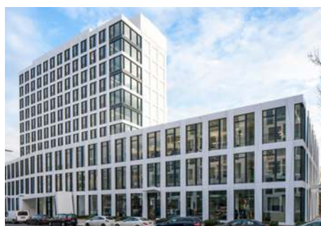
3 George - Georg-Glock-Strasse 3 - Düsseldorf - Allemagne