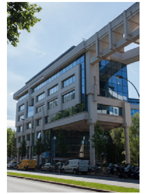
Colisée Marceau - 10 bd des Frères Voisin 92130 Issy-Les-Moulineaux