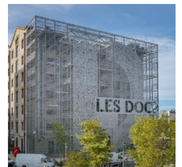
Les Docks - 10 place de la Joliette - 13002 Marseille