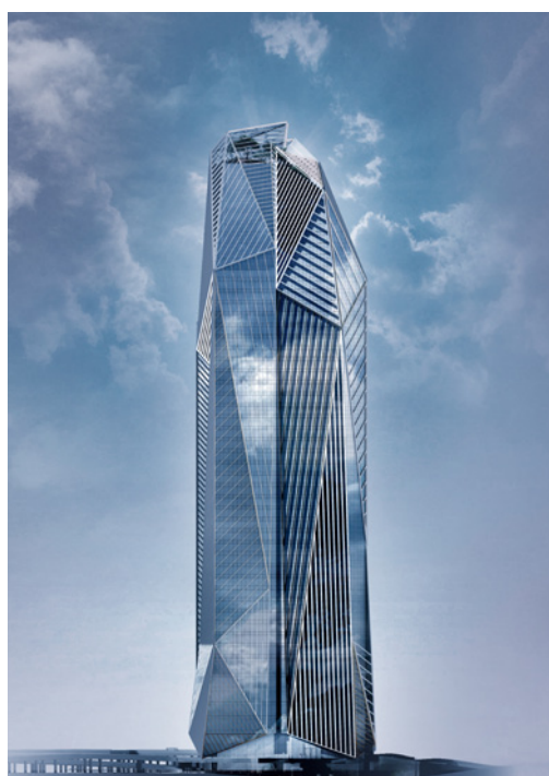
Tour Hekla - Avenue du Général de Gaulle La Défense - 92800 Puteaux - VEFA