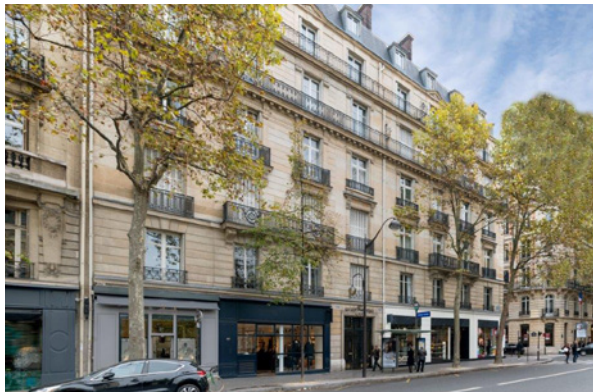
39/49/51 Avenue Victor Hugo - 75016 Paris