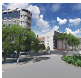
2 avenue Pasteur 94160 Saint-Mandé - VEFA