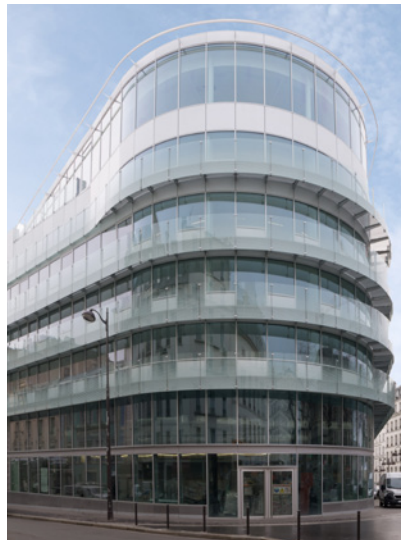
Intown - Place de Budapest - 75009 Paris