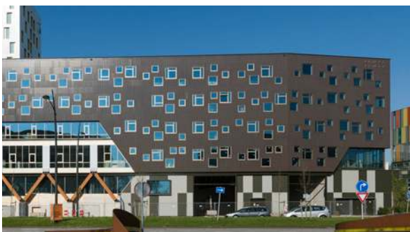
Now - Taurusavenue - Amsterdam - Pays-Bas