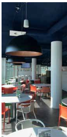
41-63 Neptunustraat Hoofddorp – Pays Bas