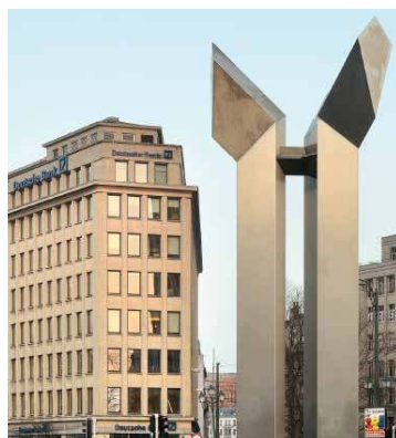
13-17 Marnixlaan 1000 Bruxelles – Belgique