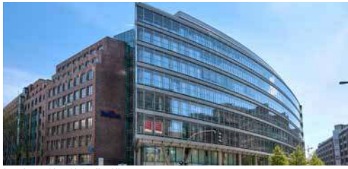
Postdamer Platz 10, Berlin, Allemagne