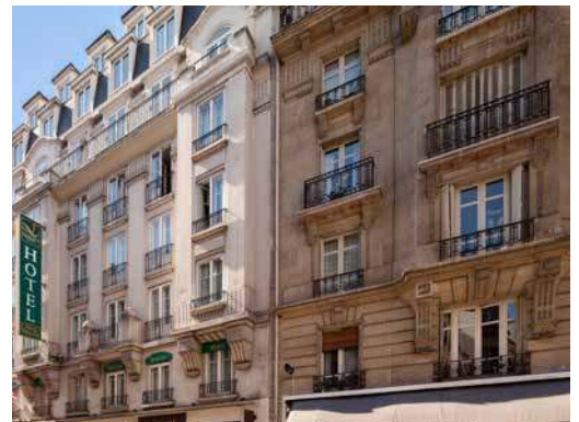
330 rue de Vaugirard - 75015 Paris