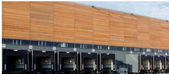
Zac de la Butte aux Bergers - 95380 Louvres