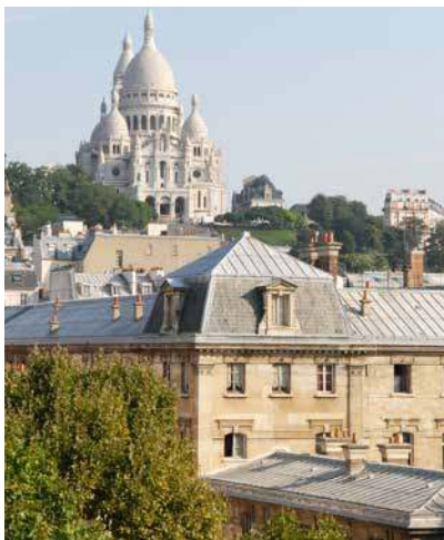
39 avenue Trudaine - 75009 PARIS (VEFA)