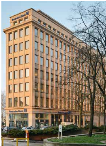
13-17 Marnixlaan 1000 Bruxelles, Belgique