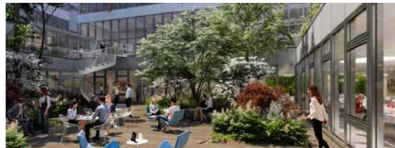
L'Académie 89-91 rue Gabriel Péri - 92120 Montrouge (VEFA)