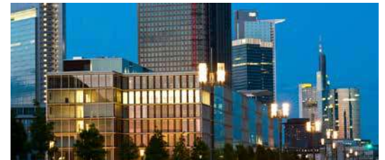
Europaallee 12-22, 60327 Francfort, Allemagne