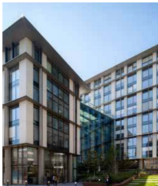
2-8 rue Ancelle - 92200 Neuilly-sur-Seine