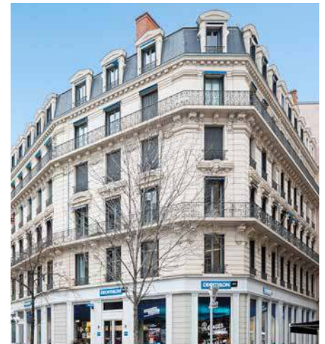
3 rue Président Carnot - 69002 Lyon