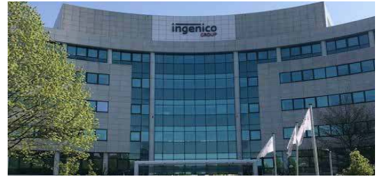
41-63 Neptunstraat Hoofddorp, Pays-Bas