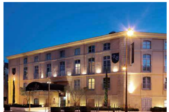
24 boulevard du Roi René - 13100 Aix en Provence