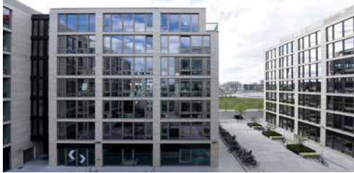
16-19 Mühlenstrasse Berlin, Allemagne