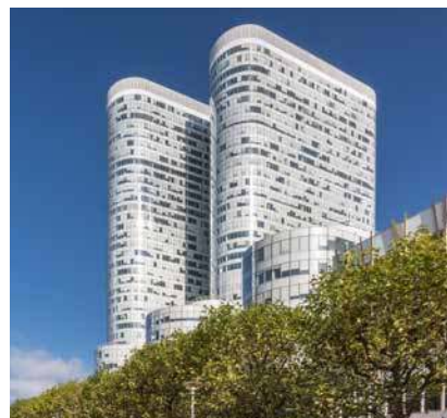
5/7 Esplanade du Gal de Gaulle - Cœur Défense - 92400 Courbevoie