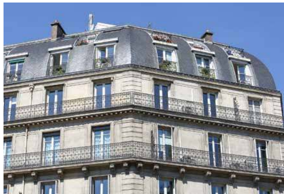
31 avenue de l'Opéra - 75001 Paris