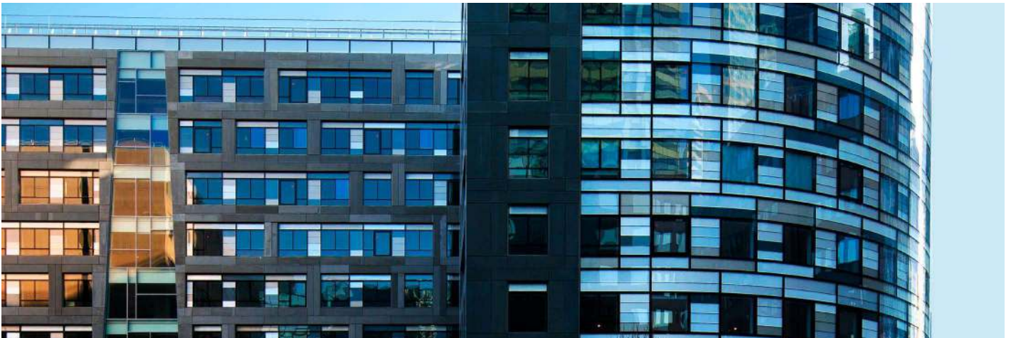
10, Place des Vosges - 92 Courbevoie - La Défense AKORA