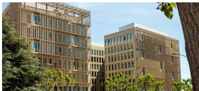
▲ 126-138 avenue de Stalingrad - VILLEJUIF (94)

Il conviendra, pour les associés désirant se porter candidat à un poste de Membre du Conseil de Surveillance et remplissant les conditions ci-dessus énoncées, de faire parvenir à la Société de Gestion avant le 31 mars 2023, un courrier de motivation indiquant leur nom, prénom, âge, le nombre de parts qu'ils possèdent, leurs références professionnelles, la liste de leurs activités au cours des 5 dernières années et de tous les mandats sociaux qu'ils exercent. Des formulaires pour postuler sont disponibles sur notre site Internet.