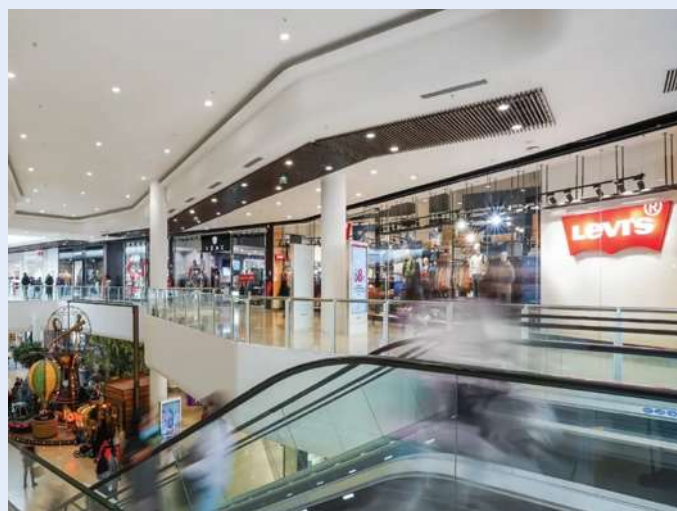
Centre commercial O'Parinor - Aulnay-Sous-Bois